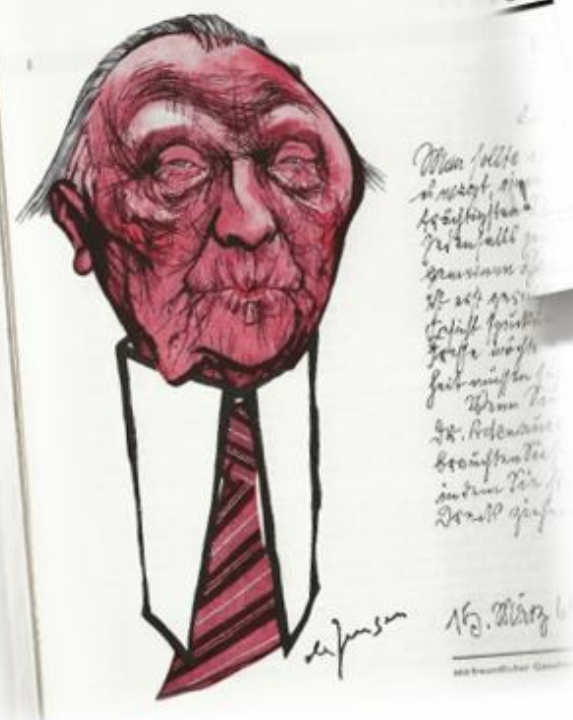
Ausschnitte aus dem „Almanach zum Presse-Funkball 1965“