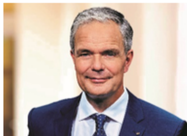
Burkard Dregger

Zur Terminvergabe bitte eine E-Mail an info@jvbb-online.de .